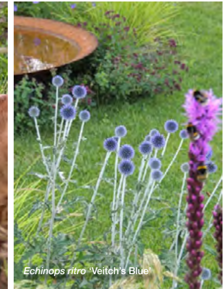
Echinops ritro 'Veitch's Blue'